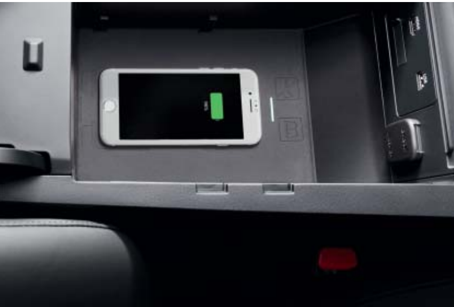
Vezeték nélküli töltő

A Mazda gondosan megtervezett kiegészítőket készített, amelyek zökkenőmentesen működnek együtt a 2021-es Mazda3-mal. A Mazda3-hoz beszerezhető eredeti Mazda kiegészítők teljes listájához keresse fel Márkakereskedéseink egyikét vagy látogasson el honlapunkra a www.mazda.hu címen.