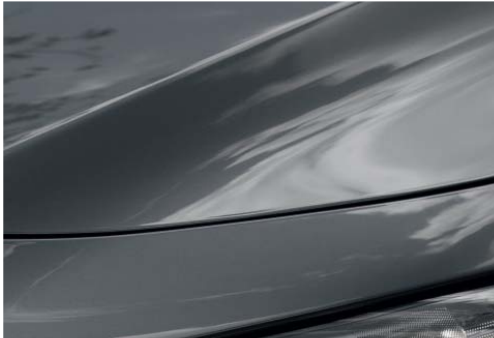
Machine szürke metál

Látogasson el webhelyünkre, ahol megtekintheti a rendelkezésre álló élénk színek választékát.