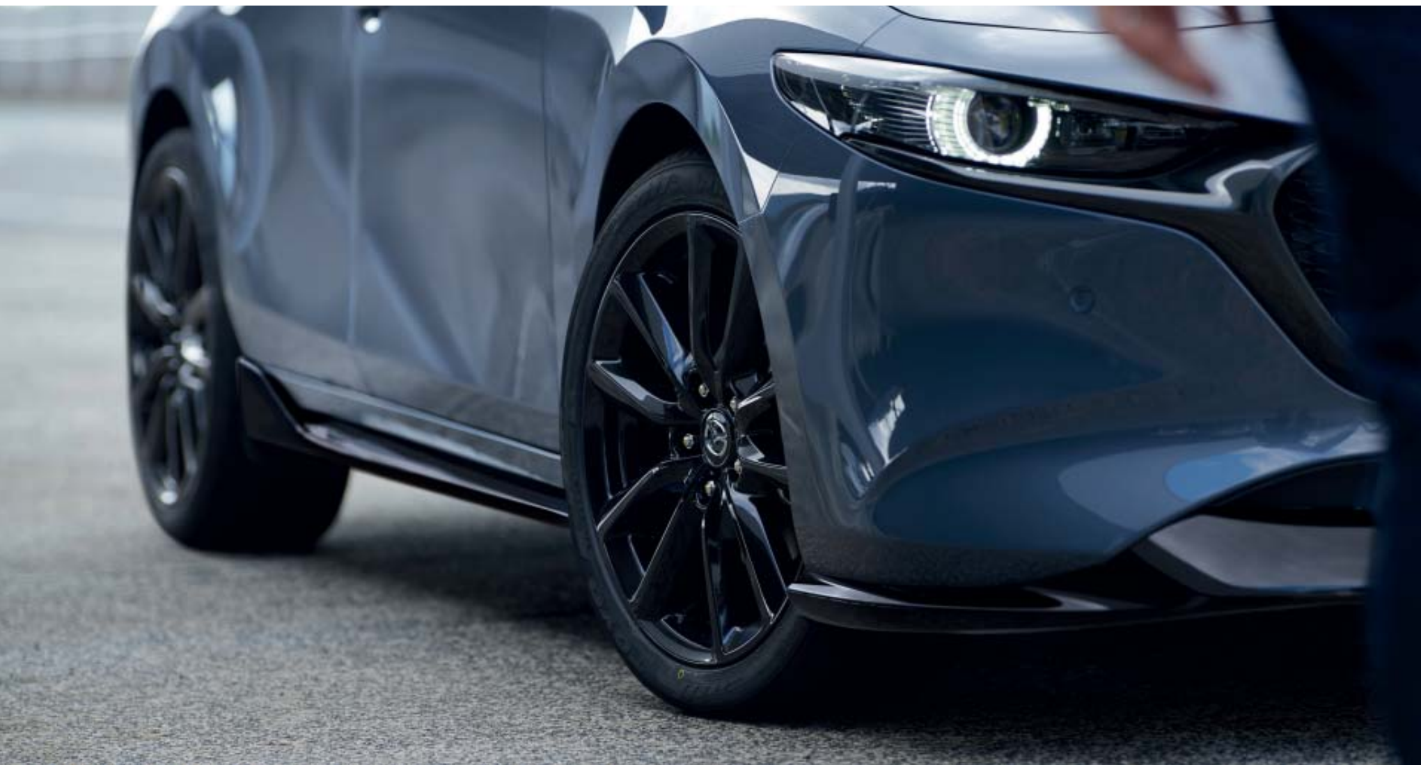
Fekete első, hátsó- és küszöbspoiler