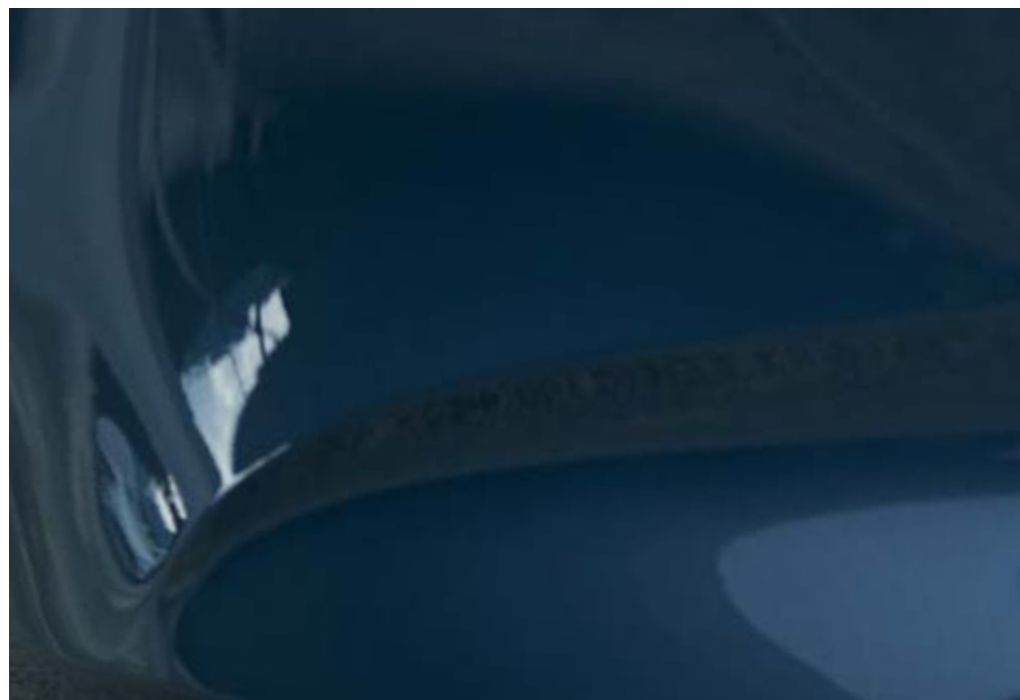
Polymetal szürke metál